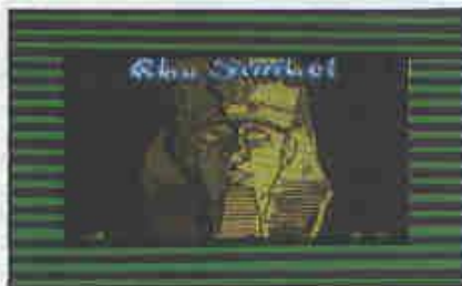
En algunos casos las rutinas de cargas especiales se hacen por razones estéticas.

La razón es que la ULA del Spectrum, que se encarga entre otras cosas de generar la señal de vídeo del ordenador, se halla conectada a la memoria según el sistema DMA o