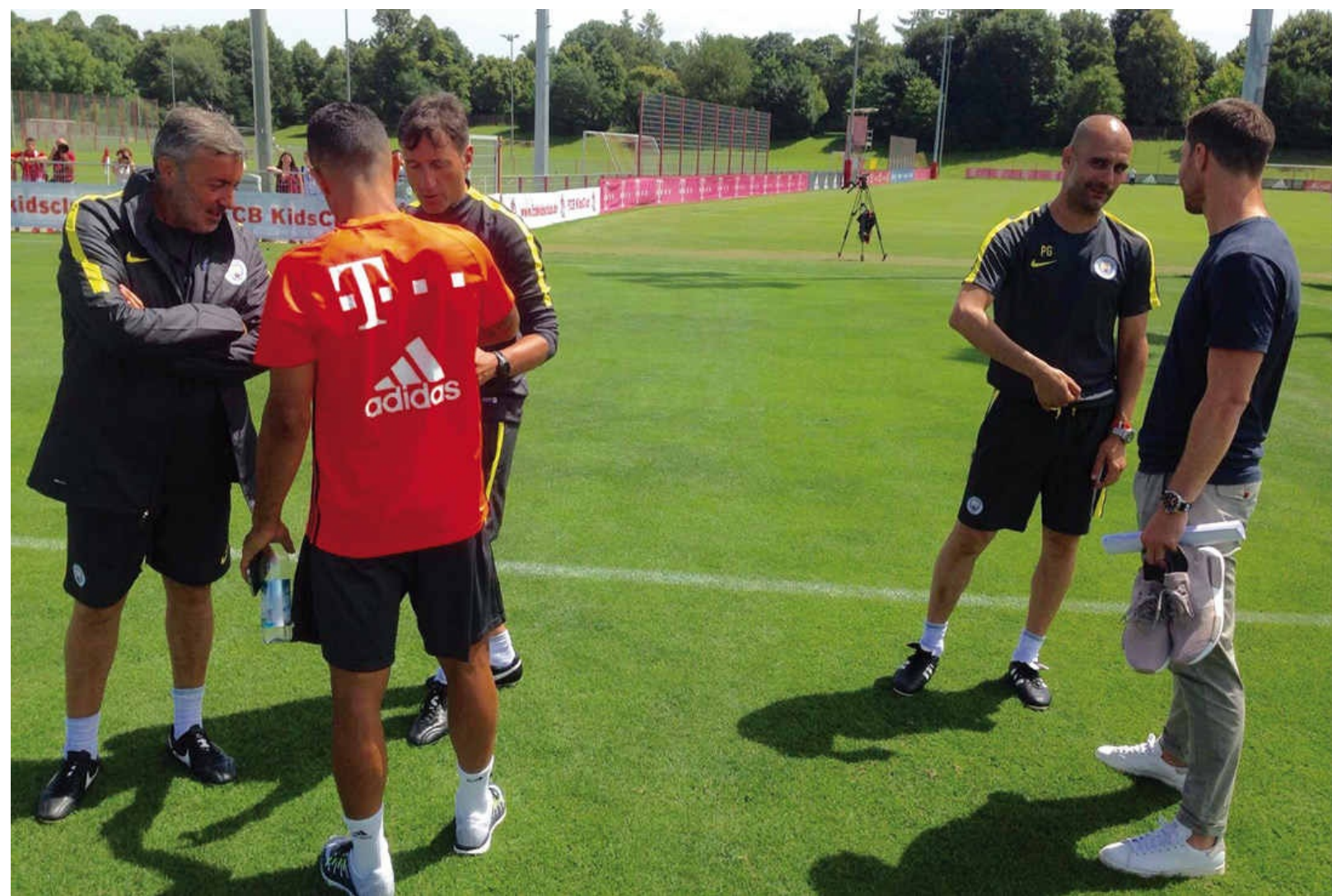
El retorno a Múnich: el 21 de julio de 2016 volvió a entrenar a su equipo en la ciudad deportiva de Säbener Strasse, pero esta vez su equipo ya no era el Bayern sino el Manchester City. El reencuentro con sus antiguos jugadores (en la imagen, con Xabi Alonso y Thiago más Domènec Torrent y Carles Planchart) y con los aficionados muniquestes fue caluroso y rebotante de cariño.