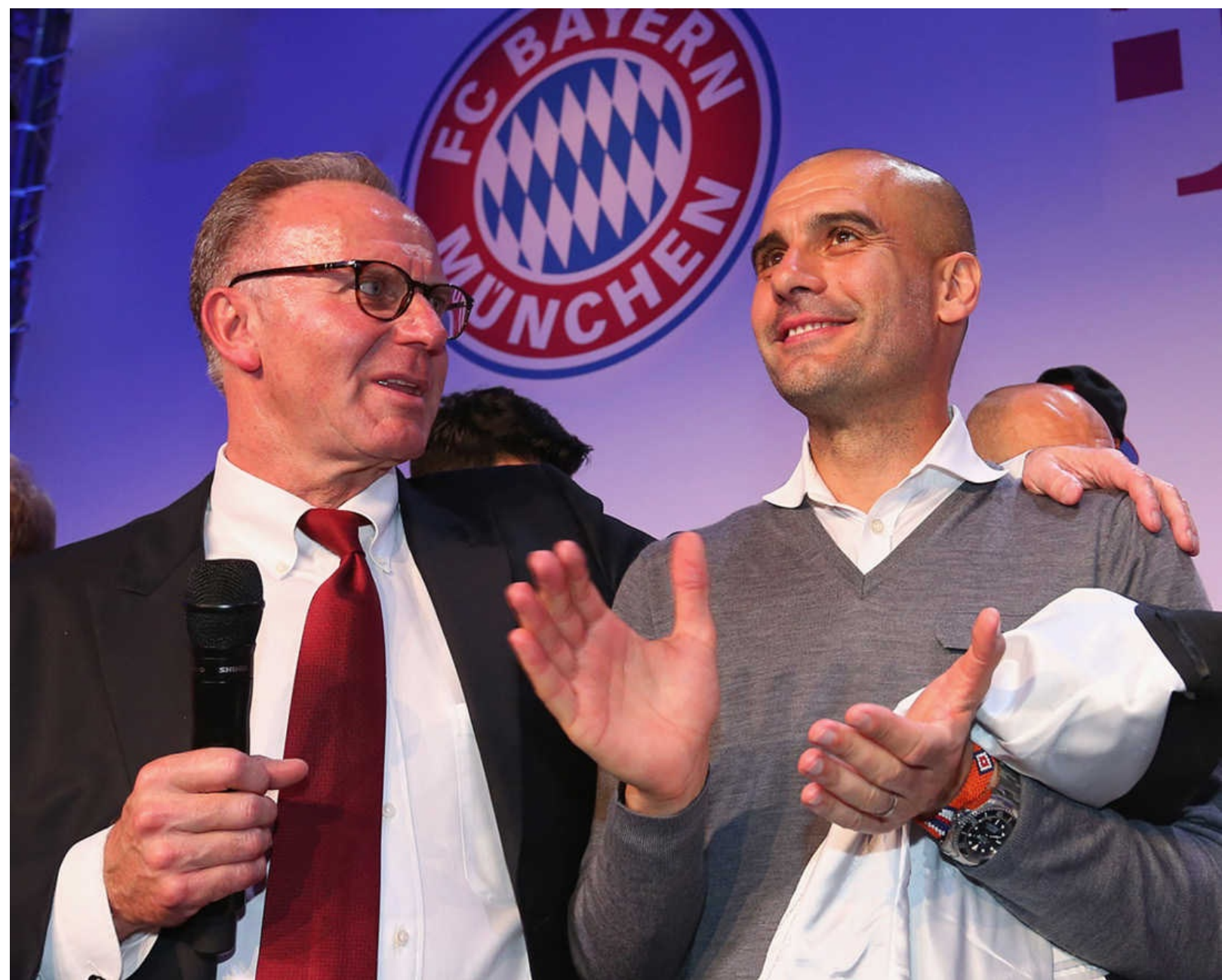
Karl-Heinz Rummenigge y Pep Guardiola, celebrando la conquista de la Copa alemana 2016 en Berlín. El séptimo y último título conseguido por el Bayern bajo la dirección de Pep.