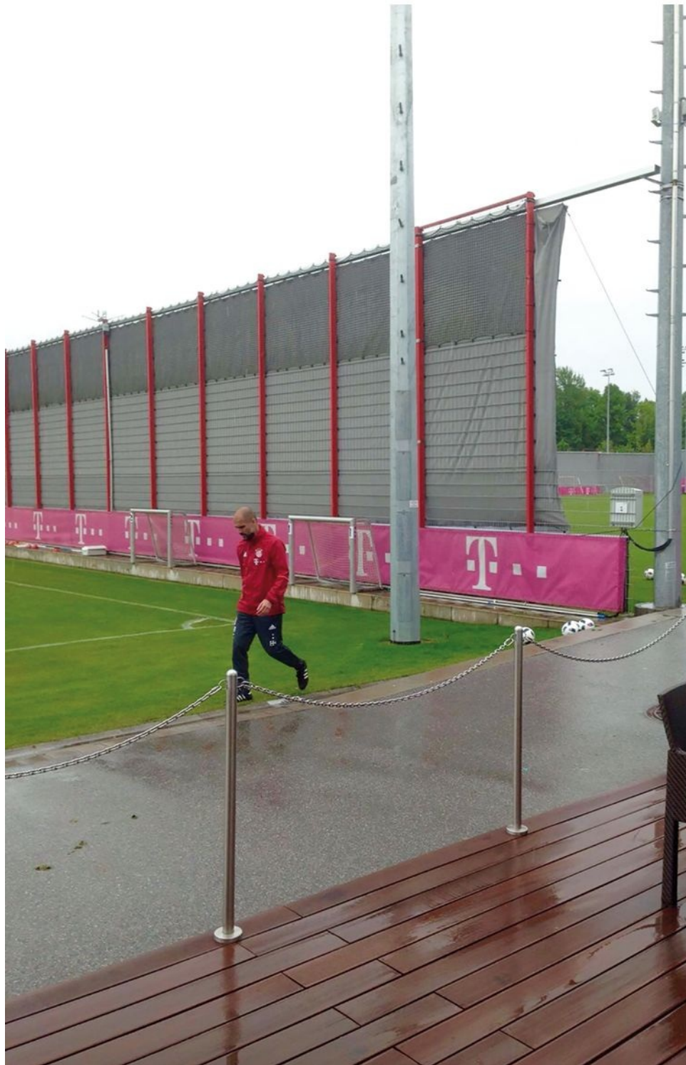
Jueves, 19 de mayo de 2016: último entrenamiento de Guardiola en la ciudad deportiva del Bayern. Llueve, como el primer día, y Pep se encarga de recoger personalmente los balones que han utilizado. Es el adiós a Säbener Strasse.