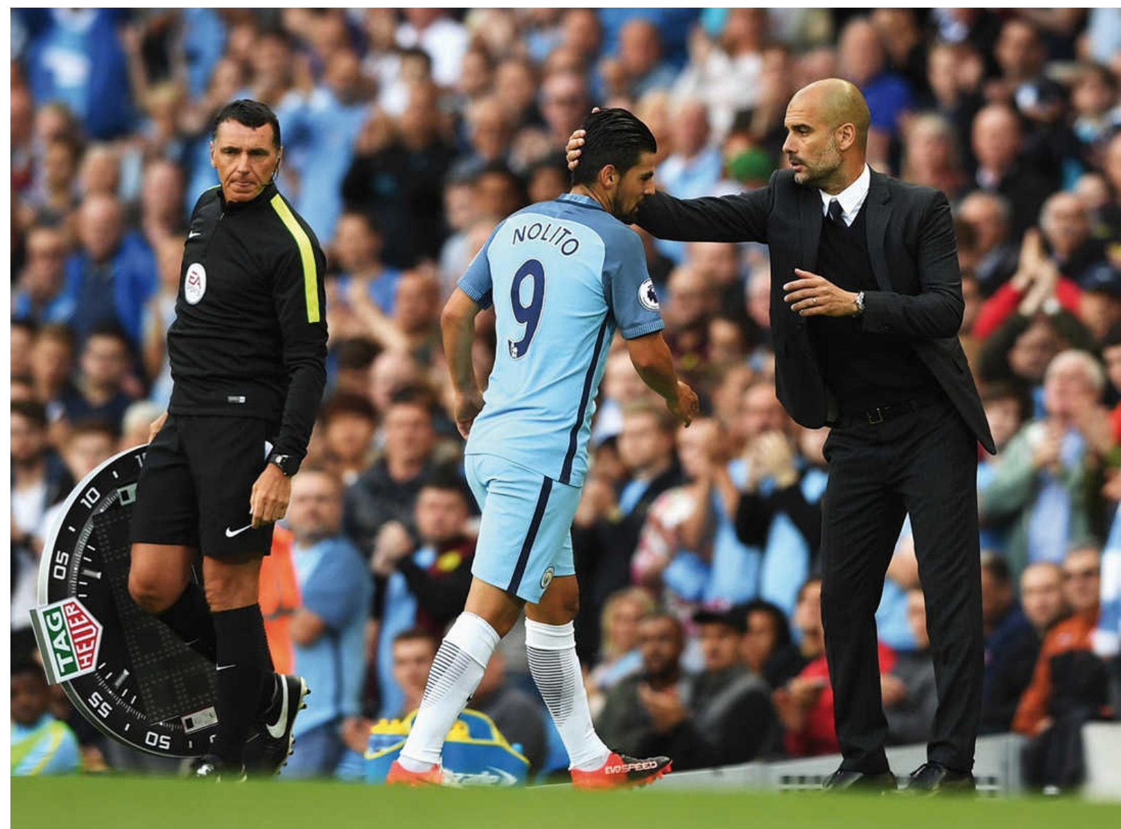
Nolito es uno de los cinco nuevos jugadores que llegaron al City de la mano de Guardiola en verano de 2016. El empleo de extremos es uno de los rasgos esenciales en el juego de Pep.