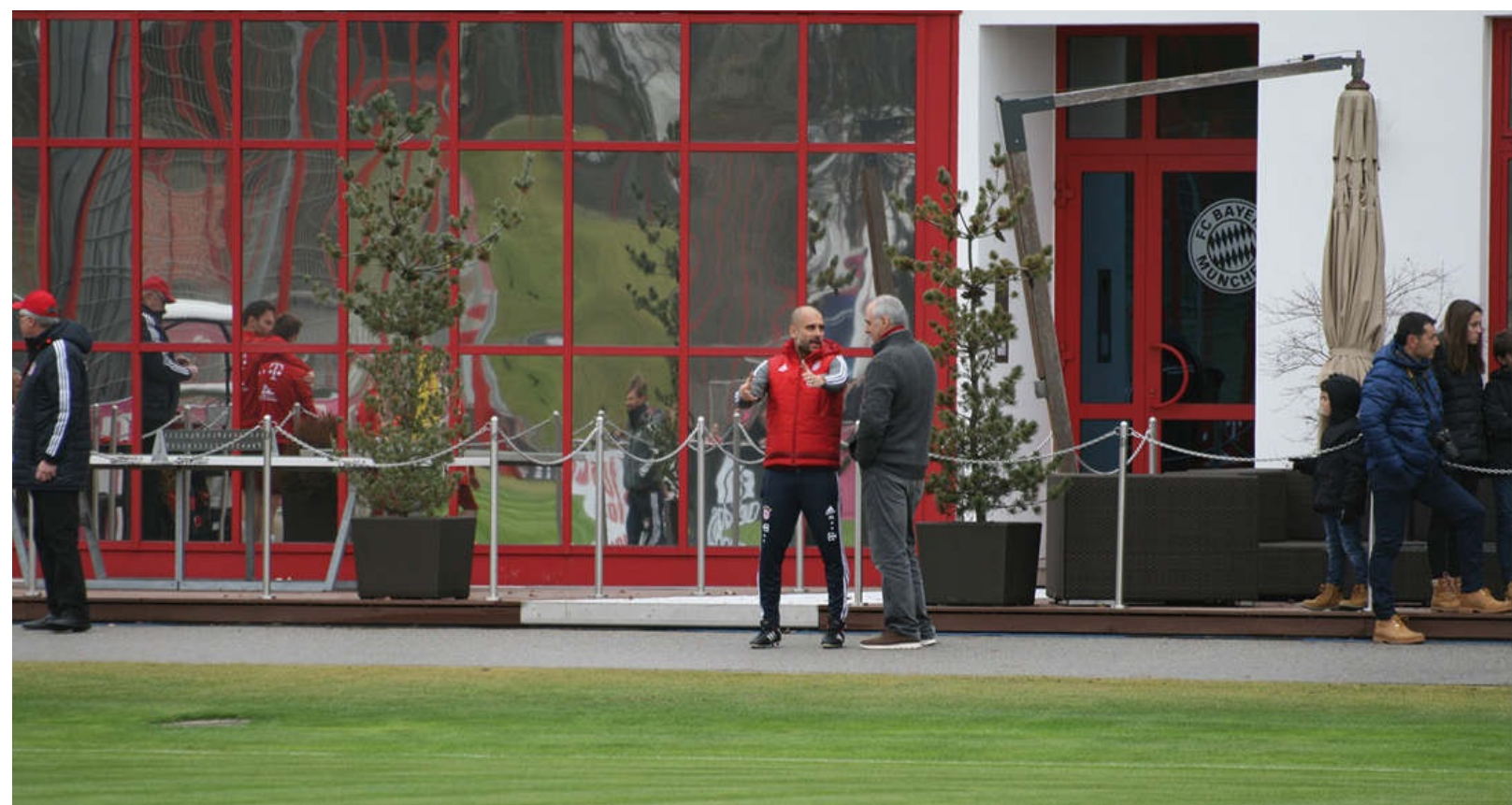
Guardiola explica al autor del libro los planes de juego que ha preparado para el enfrentamiento del Bayern contra la Juventus. Será una eliminatoria sensacional de Champions League, repleta de emoción, buen juego y dramatismo.